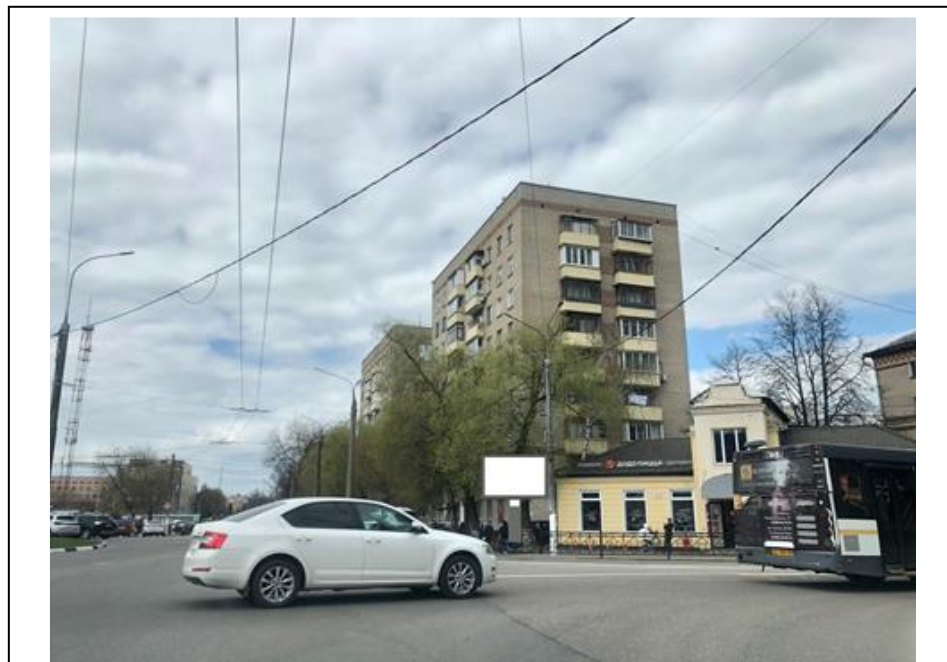
Сторона «А» (по ходу движения)