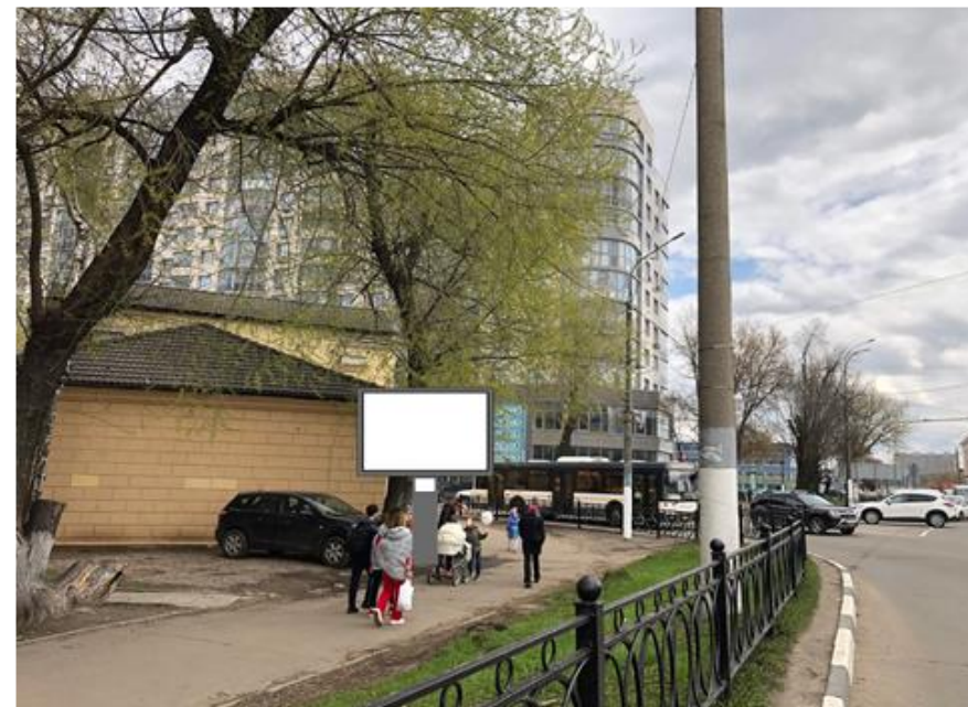
Сторона «Б» (против хода движения)